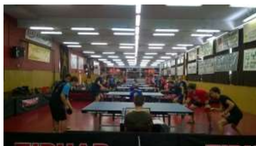
Sfeerbeeld : de groepswedstrijden werden fel betwist ...