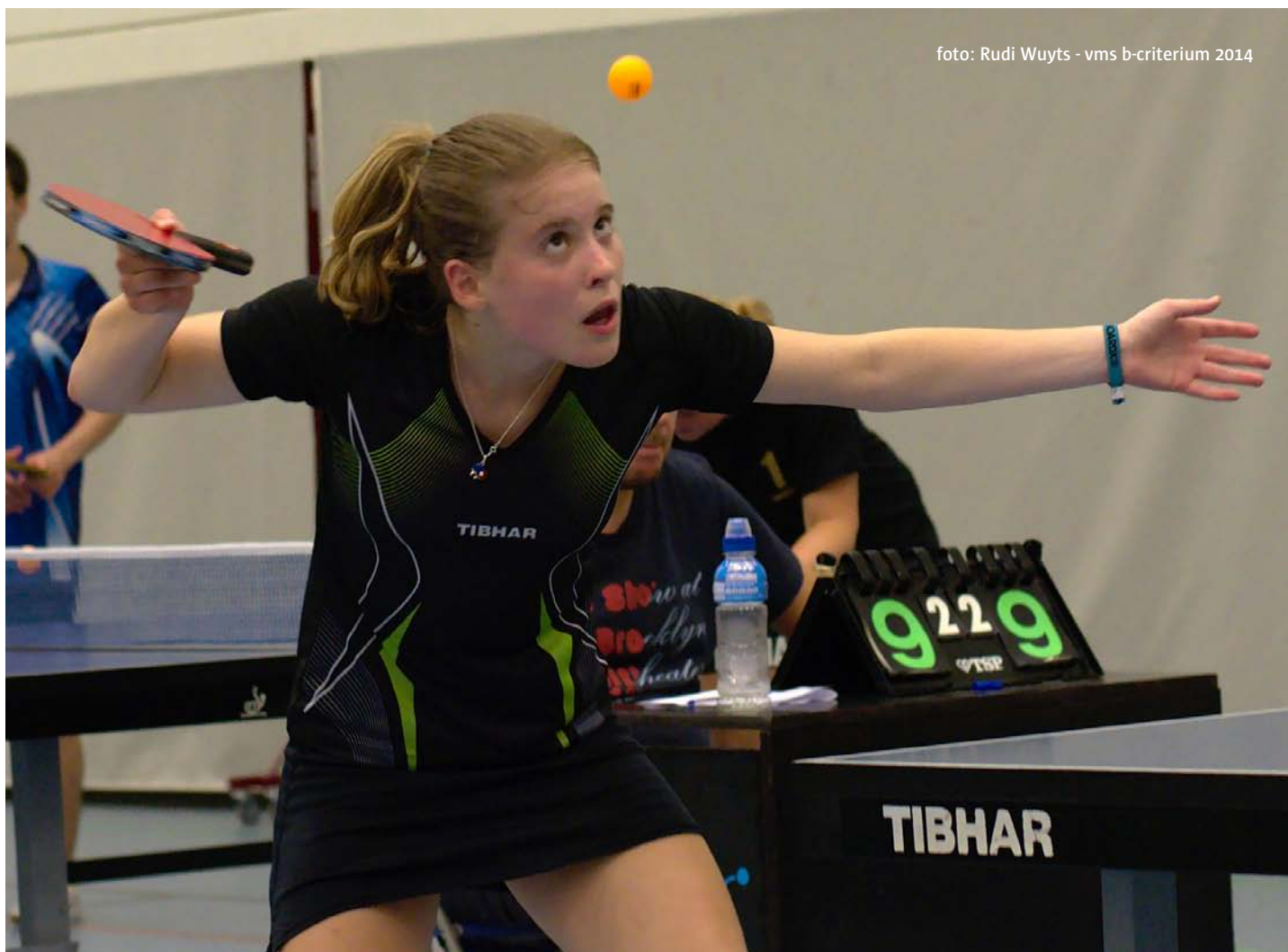
vms b-criterium 2014

Meer info op onze website: http://vlb.vttl.be