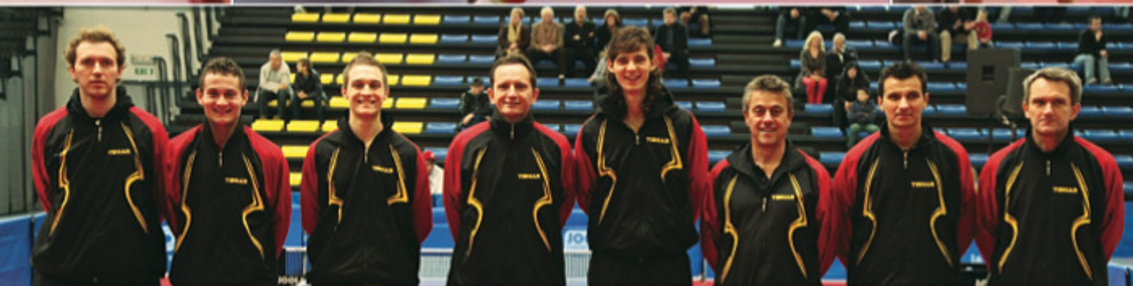
TABLE TENNIS BELGIUM